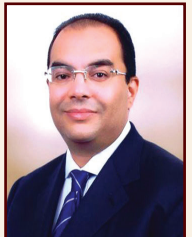
أ.د. محمود مدي الدين وزير الاستثمار السابق