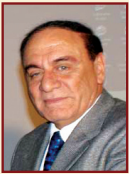
د. سمير فرج

قامت قافلة طبية من كلية طب قصر العيني بإجراء ٣٥ عملية جراحية للعيون بمستشفى الأقصر الدولي و١٥ عملية عظام لتغيير مفاصل الفخذ والكسور المضاعفة والمتعددة وذلك تحت رعاية الدكتور سمير فرج محافظ الأقصر والدكتور سامح فريد عميد الكلية . وأشار المحافظ إلى أنه تم تنفيذ برنامج تدريبي عملي وإكلينيكي لأطباء المستشفى العام والمستشفى الدولي بالأقصر وأشار إلى مساهمة نادي إينوريل الزمالك برئاسة ليلي مختار في شراء المستلزمات الطبية والمفاصل الصناعية التي تم استخدامها في العمليات الجراحية .