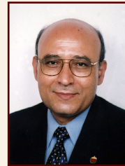
أ.د. نجيب الهاللي جوهر رئيس الجامعة الأسبق